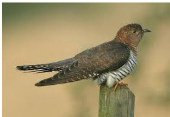
Ptica - kukavica

Pjev: https://www.youtube.com/watch?v=uvQrMmQUBrU