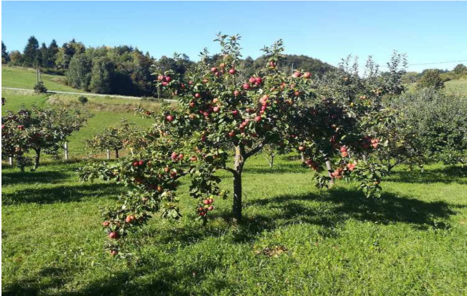
Moja najdraža voćka