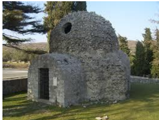
crkva sv. Dunata (otok Krk)

2. Izlažemo predmete koji su se koristili (alati, oružje, novac, odjeća, nakit...) u MUZEJIMA .